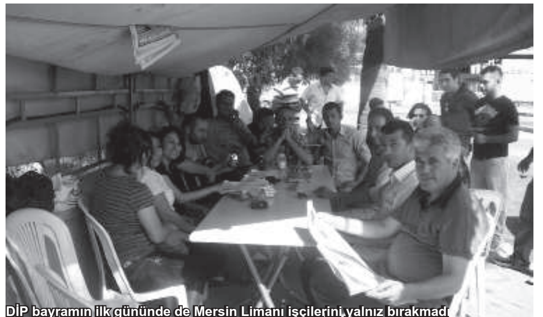
DİP bayramının ilk gününde de Mersin Limanı işçilerini yalnız bırakmadı

Direnişteki işçiler bir yandan da asıl işlerinin yanında, kendileri yerine de çalıştırılan diğer taşeron işçileriyle dayanışma talebiyle görüşmelerini sürdürmeye devam ediyor. Şu sıralar, 2 Ağustos'ta alınmış olan grev kararını fiilen uygulamaya üzerine odaklanmış olan