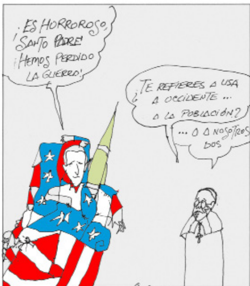
Biden: Sayın Papa durum korkunç! Savaş kaybettik! Papa: ABD ve Batı'yı mı kast ediyorsun? Halkı mı? Yoksa seni ve beni mi?

Bunlar böyle derken solcular, anti-emperyalistler de "ABD'nin yenildiği falan yok" diye arkadan koro yapıyorlar.