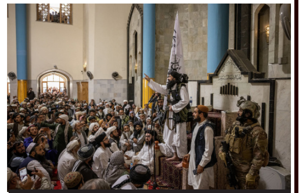
Taliban lideri Molla Abdülgani Birader Kâbil camiiinde hutbe okurken elinde Amerikan Colt marka M4 tüfeği

Taliban bu saldırı sırasında en hazırlıklı siyasi ve askerî güç olarak bu direnişin başında yer aldı. ABD ile birlikte saf tutanlar ise büyük halk kitleleri gözünde vatan haini oldu. Afgan ordusu onun için ABD askerî çekilir çekilmez dağıldı. ABD'nin yanında